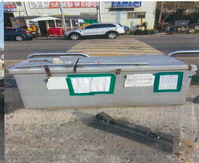
6. 기타 적치물①(1.72m×0.84m)