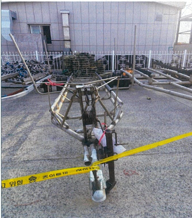
3. 번호판 부재