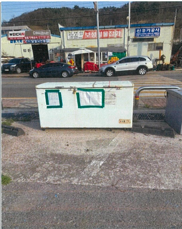
7. 기타 적치물②(1.69m×0.67m)