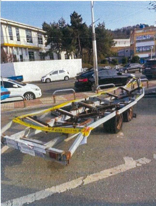
7. 번호판 부재