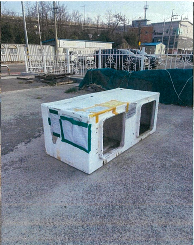
8. 기타 적치물③(3.56m×2m)