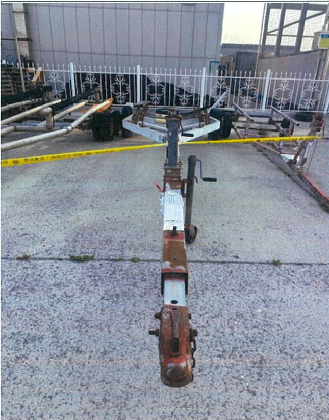
5. 번호판 부재