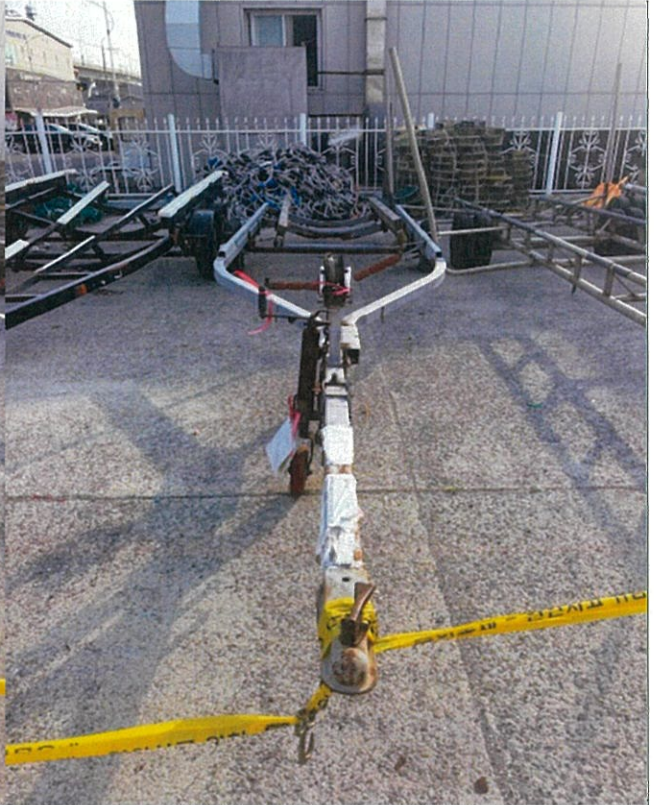
2. 번호판 부재