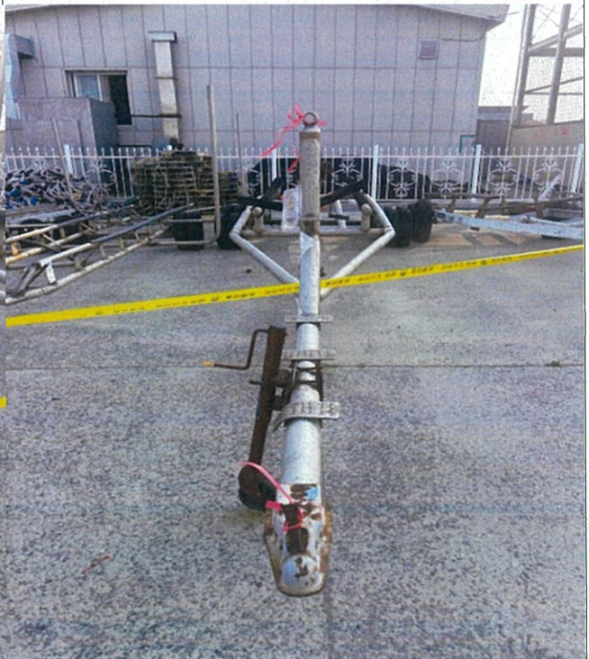
4. 번호판 부재