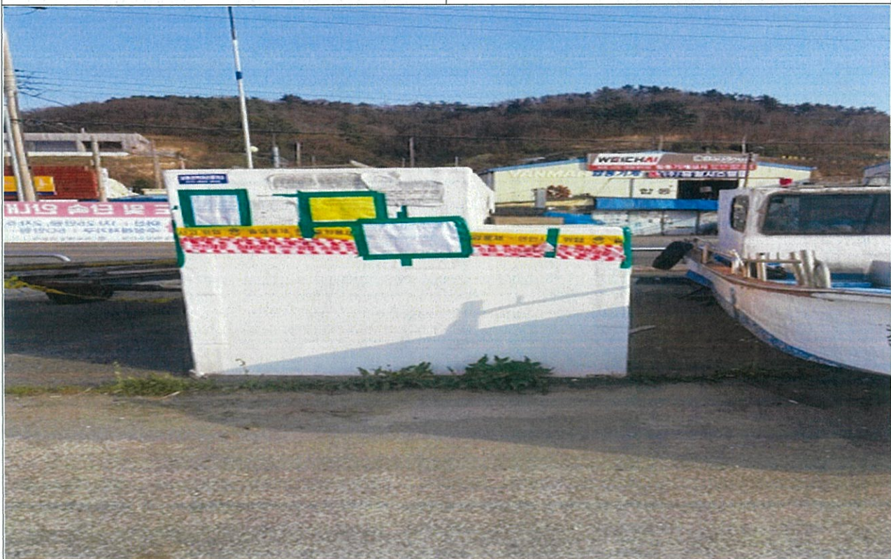
9. 기타 적치물④(3.31m×1.82m)