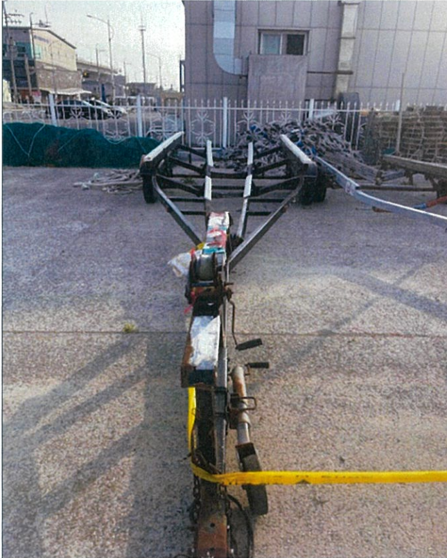
1. 번호판 부재