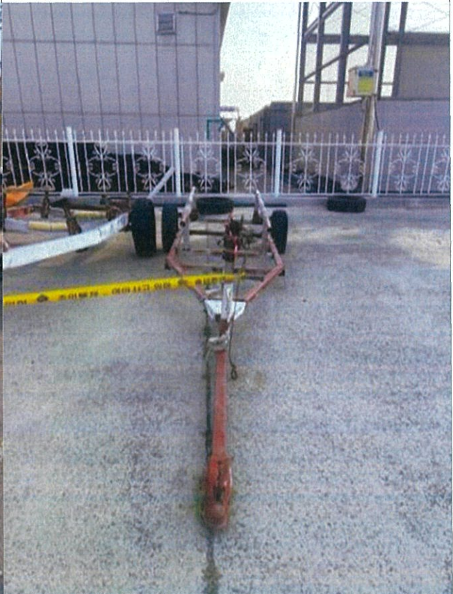
8. 번호판 부재