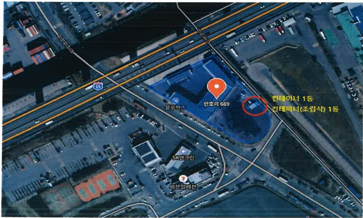
경기도 평택시 포승읍 만호리 669번지